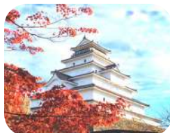
↑ローレンさんが撮った鶴ヶ城の写真

協会のイベントをきっかけに、私を暗闇から引き上げてくれた会津の人たちに出会いました。それからは、協会が主催するスポーツイベント（ドッジビーやバレーボールなど）や英会話サークルFIND（ファインド）にも少しずつ参加するようになりました。そうして交流の輪が少しずつ広がり、まだ会津には住んでいなかったにもかかわらず、この素晴らしいコミュニティに関わる機会が増えていきました。