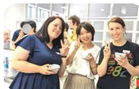
↑日本語サークルあつはな

協会にさらに関わるようになってからは、「外国語おはなしのへや」で英語で本を読み、楽しく活動したりと、ボランティアとしての活動が増えていきました。そして、国際交流フェスティバルではハンドペイントを担当し、そこでは新しい人々と出会いながら楽しい時間を過ごすことができました。