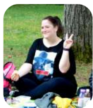
↑2021年 初参加したハイキング