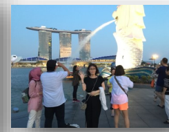
マーライオンと私