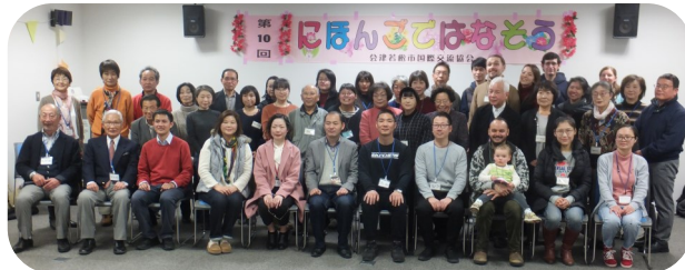
にほんごではなそう