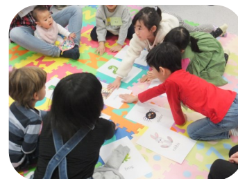
外国語おはなしの部屋