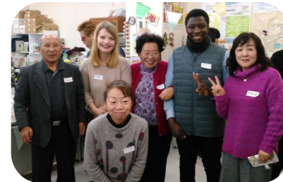
新年ポットラックパーティ