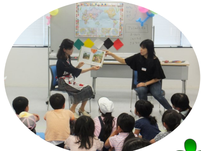
外国語おはなしの部屋

2日 会員総会・記念講演会 16日 日本文化体験 蒔絵体験 24日 外国語おはなしのへや